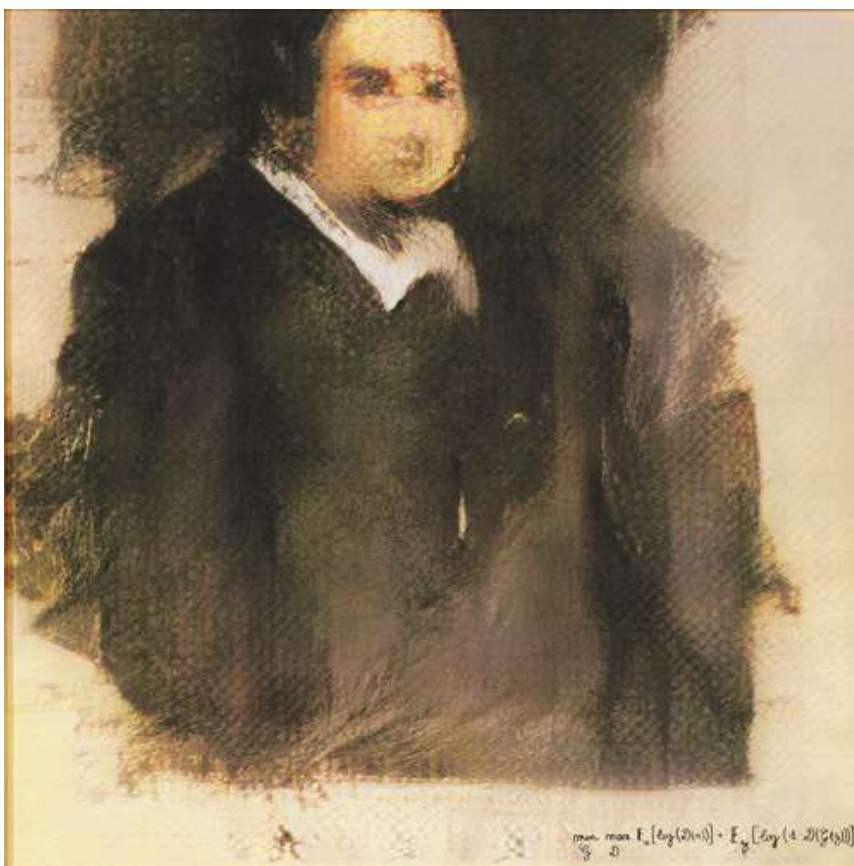
Edmond de Belamy, creat cu o rețea generativă adversă în 2018 a fost vândută cu 432.500 dolari americani

Putem spune că, datorită acestor influențe, se produce o schimbare a preferințelor estetice și, implicit, artistul din ziua de astăzi este supus unor noi provocări pe care speră că le poate trece și cărora le poate face față. În funcție de stilul pe care îl abordează fiecare artist în parte, din punctul meu de vedere, reușește să răspundă noilor cerințe ale publicului cunoscător de artă și reușește să se facă cunoscut, el și opera sa, să se impună pe piața de artă și chiar să deschidă noi drumuri și noi căi de manifestare artistică inovatoare.