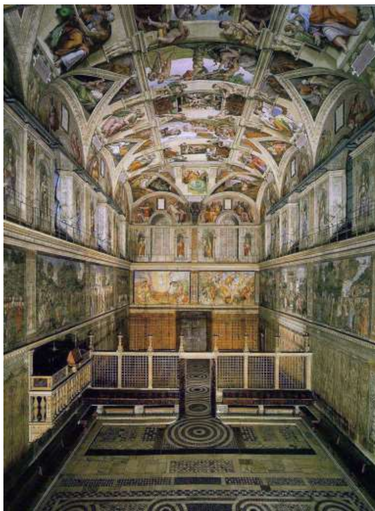
Interior Capela Palatului Papal din Vatican-Capela Sixtină, Michelangelo Buonarroti, 1508-1512

https://ro.wikipedia.org/wiki/Capela_Sixtin%C4%83