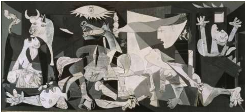
Guernica, Pablo Picasso, Muzeul Reina Sofia din Madrid

Urmărind îndeaproape manifestările artistice de-a lungul timpului, ne dăm seama că în dezvoltarea culturii și implicit a artelor au participat o serie de oameni, care prin activitatea lor au colaborat la dezvoltarea artei. Aceștia, prin demersul lor, au creat sau ajutat, la înființarea unor instituții, pinacoteci, muzee, școli de artă, colecții particulare de artă și Academii.