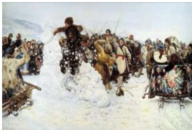
Vasili Surikov, Luarea unei cetăți de zăpadă