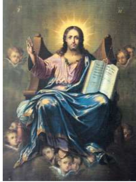
Leonardo da Vinci, Salvador Mundi, (1500) Nicolae Grigorescu, Iisus Hristos învățător

Urmărind îndeaproape manifestările artistice de-a lungul timpului, ne dăm seama că în dezvoltarea culturii și implicit a artelor au participat o serie de oameni, care prin activitatea lor au colaborat la dezvoltarea artei. Aceștia, prin demersul lor, au creat sau ajutat, la înființarea unor instituții, pinacoteci, muzee, școli de artă, colecții particulare de artă și Academii.