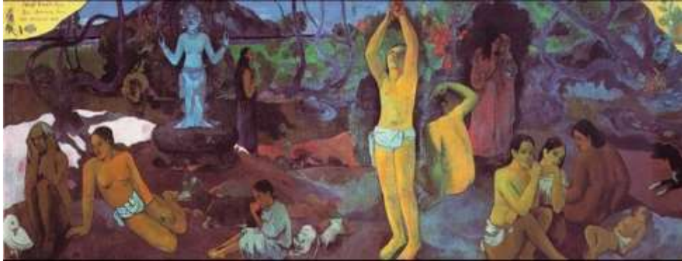
Paul Gauguin, De unde venim? Ce suntem? Încotro ne îndreptăm?, 1897, ulei pe pânză.