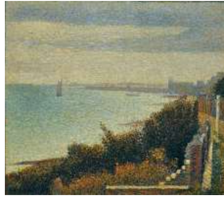
Georges Seurat, Grandcamp, Seara, ulei pe pânză, 1885, Muzeul de Artă Modernă din New York.