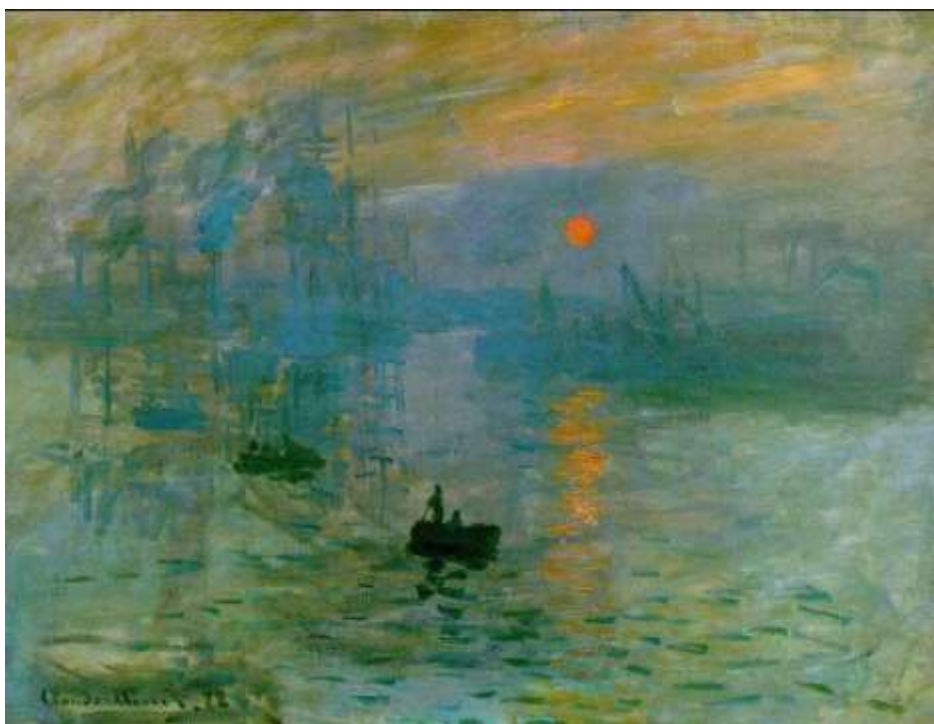
Claude Monet, Impresie. Răsărit de soare, ulei pe pânză, 1872, Muzeul Marmottan, Paris.