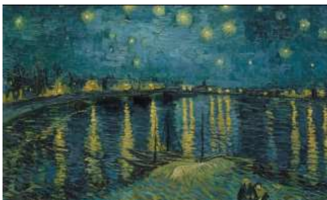
Vincent van Gogh, Noaptea înstelată peste Rhone, 1888, Muzeul, Orsay, Paris.