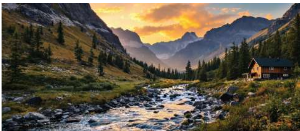
Imagine realizată cu Flux 1.1 Pro în modul Raw (noiembrie 2024)

De asemenea, mai poate fi utilizată și conversia imagine-imagine, AI transformând imaginea de intrare, pe baza unor solicitări, în imagine fotorealistică sau chiar poate realiza imagini aplicând un anumit stil artistic. Prin utilizarea conversiei imagine-video, AI poate realiza animații sau clipuri video scurte, plecând de la o imagine sau secvență de imagini.