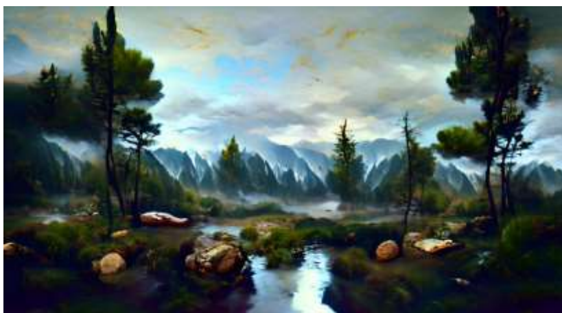
Imagine realizată cu VOGAN-CLIP (NightCafe Studio, martie 2023)

Boom-ul AI început la sfârșitul anilor 2020, a permis utilizatorilor generarea fără efort (sau cu efort minim) a imaginilor digitale din descrieri în limbaj natural, așa cum sunt modelele text-imagina DALL-E, Midjourney, FLUX.1 și Stable Diffusion. Aceste modele text-imagina, preiau solicitarea în limbaj natural, producând apoi imaginea corespunzătoare descrierii respective. Utilizatorul introduce solicitări utilizând conversia text-imagina, iar AI produce elemente vizuale corespunzătoare.