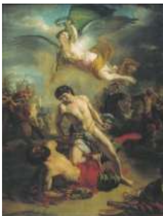
Andrei Ivanov, Prințul Mstislav înfrângându-l pe Rededya