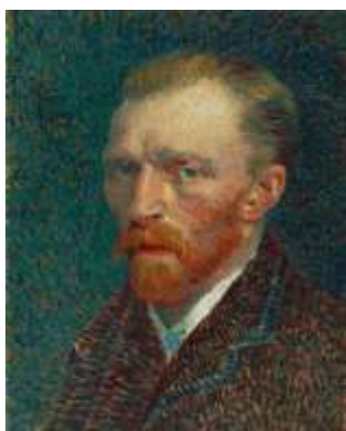
Vincent van Gogh, Autoportret, 1887, Institutul de Artă din Chivago.