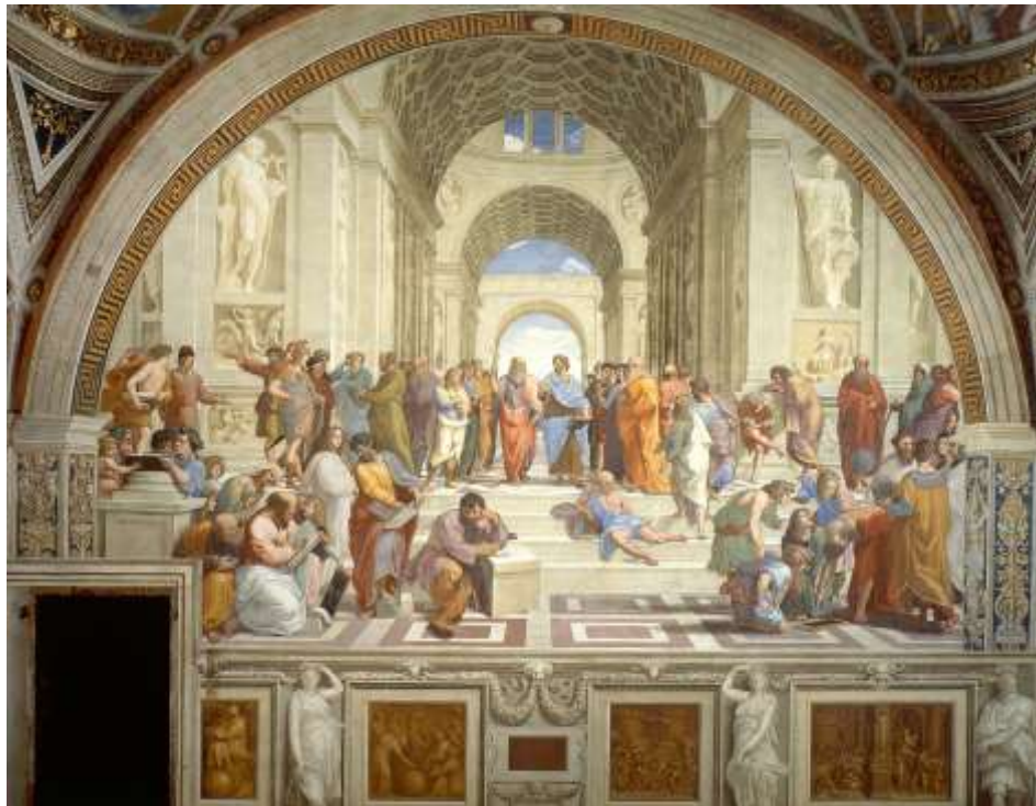
Rafael, Școala din Atena, frescă, 550 x 770 cm, (1509-1511)