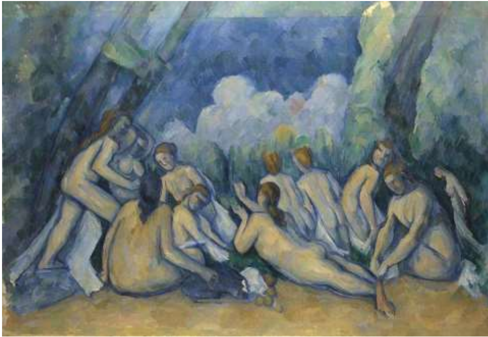
Paul Cezanne, Scăldătorii, 1898-1905, ulei pe pânză, Galeria Națională din Londra.