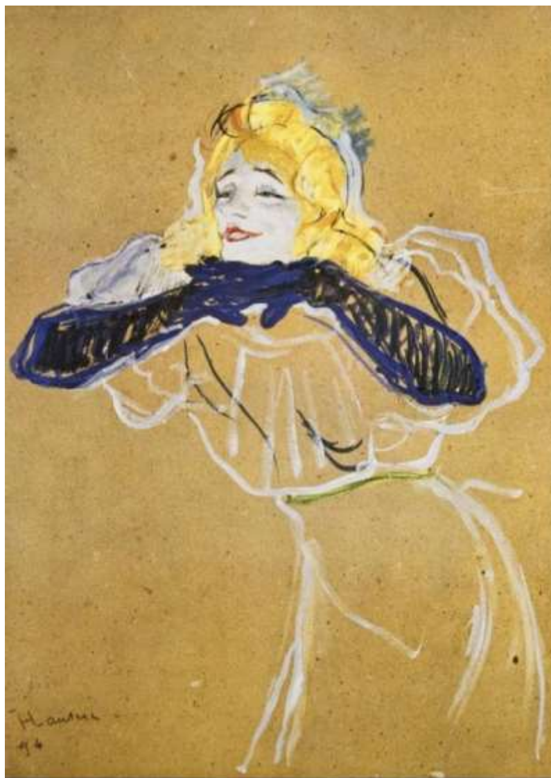
Henri Toulouse-Lautrec, Yvette Guilbert cântând „Linger, longer, loo”, 1894, Muzeul Pușkin, Moscova.

Operele de artă sunt diferite și din prisma materialelor și tehnicilor de lucru folosite de artist; pentru fiecare material sunt tehnici specifice de lucru, iar pentru fiecare lucrare acesta folosește elementele de limbaj plastic și mijloacele de expresie în mod diferit, iar acestea fiind cele care stau la baza realizării operei. Astfel, susțin că avem nevoie de artă în viața noastră și că aceasta este necesară și accesibilă oricui, prin educație.