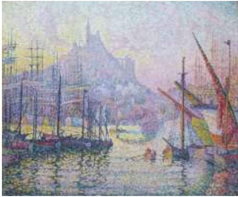
Paul Signac, Vedere asupra portului din Marseille, 1905.