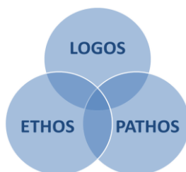
Triunghiul retoric al lui Aristotel

În cadrul discursului politic strategia de argumentare se realizează cu ajutorul argumentelor și a tehnicilor argumentative, natura cărora variază în funcție de poziționarea lor în trihotomia aristotelică logos-ethos-pathos , sau, altfel spus, pe axa raționalitate-afectivitate.